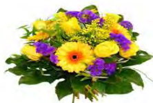
Herbert Wiednig (80) Obervellach 205/2

Wir wünschen alles Gute sowie viel Gesundheit für´s neue Lebensjahr!